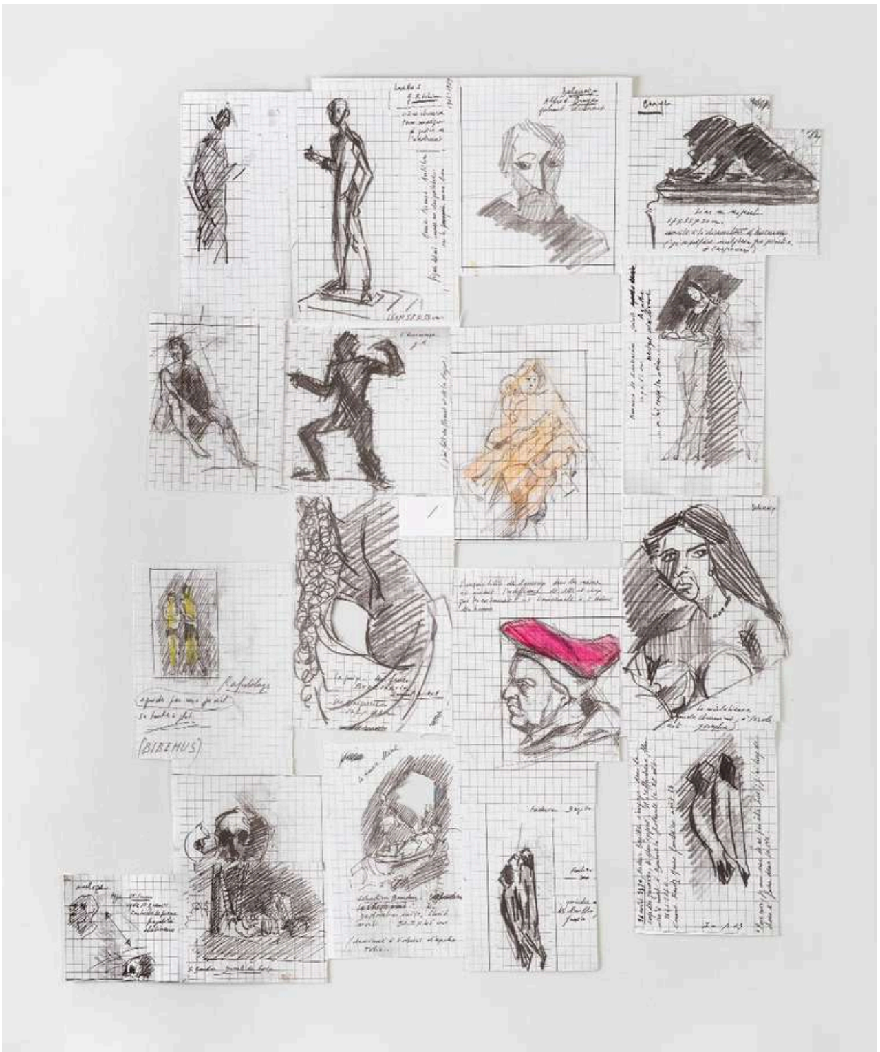
Pierre Buraglio, montage de croquis, 2009, infographie, 79 × 61 cm, collection de l'artiste, © Adagp, Paris, 2024. Reproduction interdite sans autorisation.