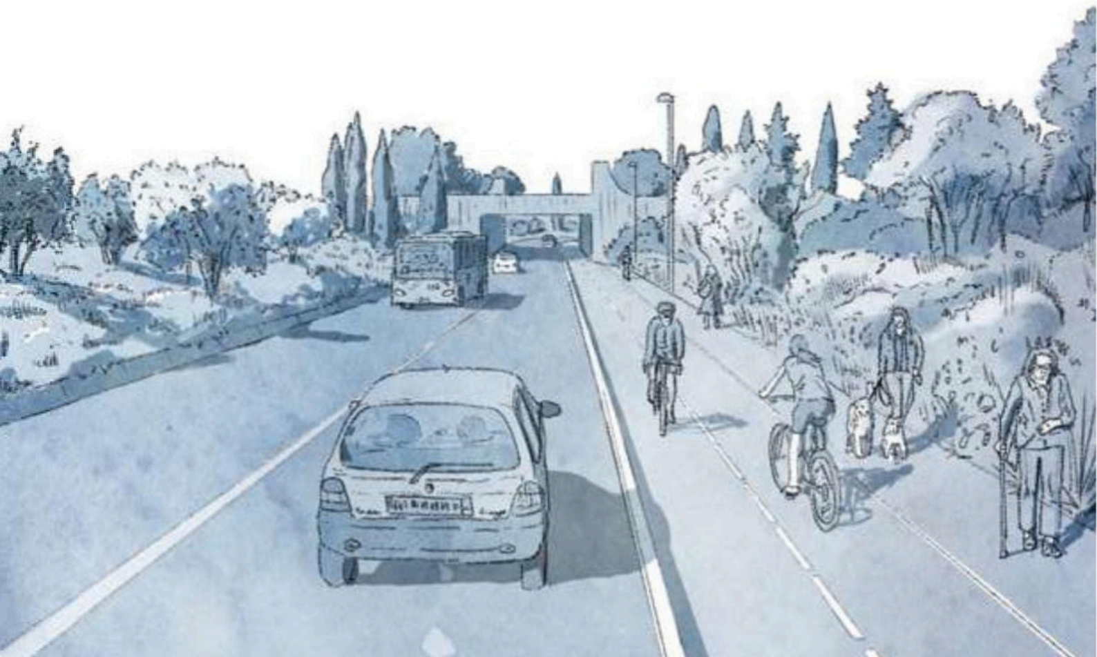
Perspective route de Lodève à Juvignac

L'ensemble des aménagements réalisés permettent de réduire les vitesses automobiles, développer le réseau piéton et cyclable de la commune et garantir la sécurité des cyclistes, des piétons, ainsi que celle des riverains du quartier.