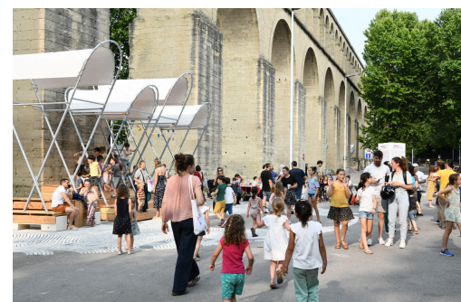
L'été aux Arceaux 2023

Un demi-siècle plus tard, cet espace emblématique doit renouer avec ses usages passés et mérite d'être rénové et embelli pour redonner tout son éclat au cœur de la cité devenue métropole.