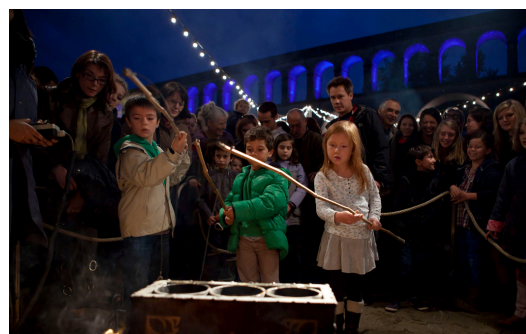
La Kermesse pyrotechnique et culinaire de la compagnie La Machine - ZAT 2012