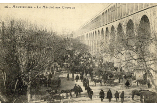
Archives de Montpellier

Enfin, de juin à octobre 2023, s'est déroulé l'été aux Arceaux avec des aménagements transitoires permettant à la fois de préfigurer le futur aménagement et d'offrir aux riverains la possibilité de se réapproprier progressivement cet espace public.