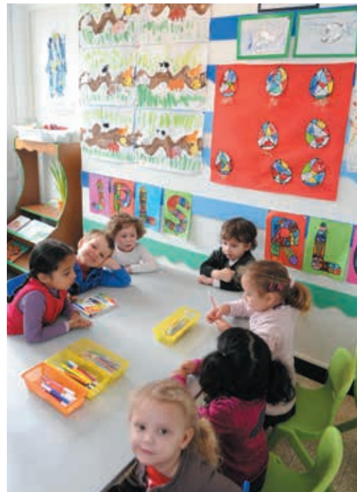
À l'école bilingue Antonia, les enfants apprennent à lire en français, mais pratiquent aussi l'anglais dès 2 ans.