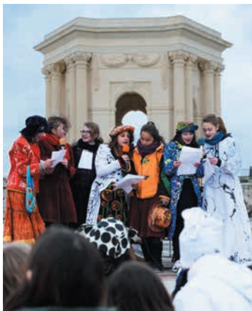
Au Peyrou en mars dernier, le carnaval des calendretas a réuni les trois écoles occitanes de Montpellier.

L'espagnol et l'arabe sont des langues parlées en famille par de nombreux enfants de l'agglomération. Ils peuvent se perfectionner au collège, avec la section internationale arabe au collège Louis Germain à Saint Jean de Védas et la section internationale espagnole au Collège