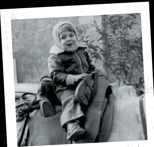
Laurent Ballesta // biologiste et photographe marin, plongeur. Né le 15 mai 1974 à Montpellier

8 personnes travaillent pour Andromède, en plus de mes deux associés. Nous nous sommes installés à Carnon en 2011, après avoir passé 8 ans dans la pépinière de l'Université de Montpellier 2, où j'ai fait mes études de biologie marine. La société a une activité de bureau d'études, de vulgarisation scientifique et de club de plongée.