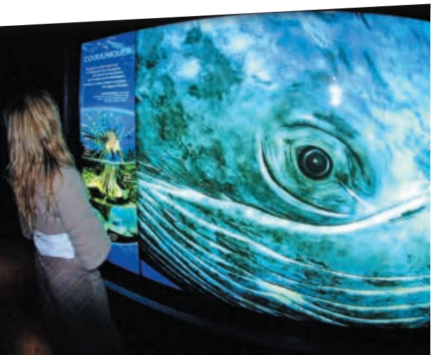
L'aquarium Mare Nostrum m'a demandé cette photo d'œil de baleine pour l'espace dédié aux enfants, « au cœur de la vie marine ». Je fais régulièrement des conférences dans cet établissement de l'Agglomération.

Après avoir cherché pendant des années, j'ai réussi à acheter une cabane au bord de l'étang de l'Or. Je suis à 5 minutes de la cuisine de ma grand-mère à Vendargues, de l'aéroport, de ma société à Carnon, à 10 minutes de Montpellier, et en même temps, en pleine nature. C'est idéal.