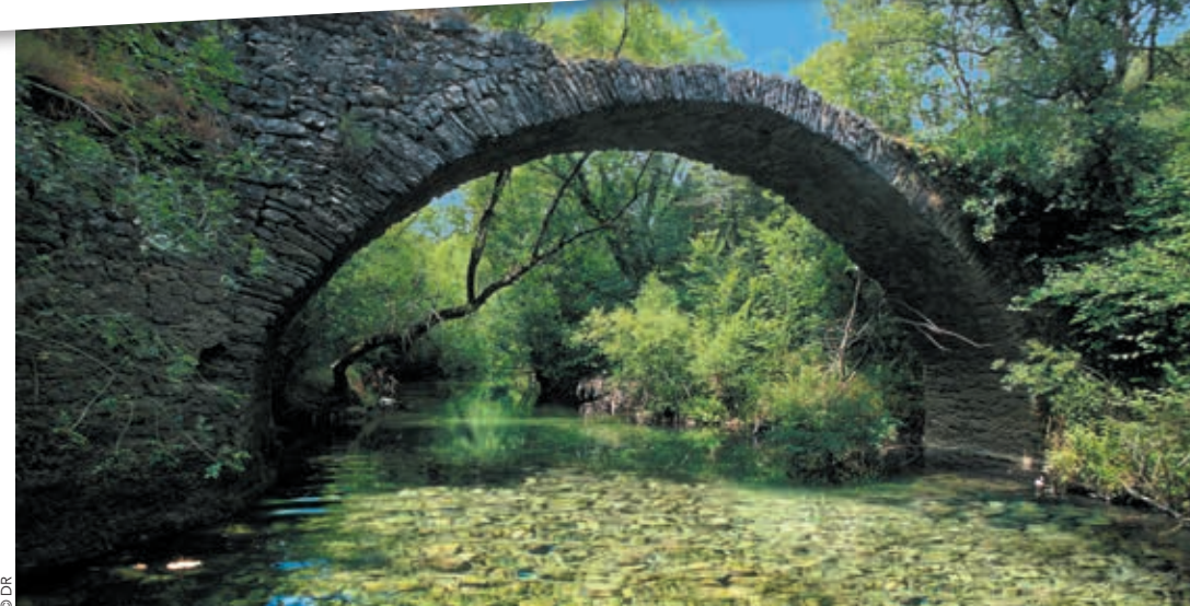
J'ai beaucoup photographié la vie sous-marine de la Buège, au nord de Montpellier. J'y ai découvert une crevette bleue inconnue, que je n'ai revue qu'une fois, au lac du Salagou. C'est une photo prise dans cette rivière qui m'a permis d'être publié dans Paris Match, à qui j'ai vendu 140 photos depuis.