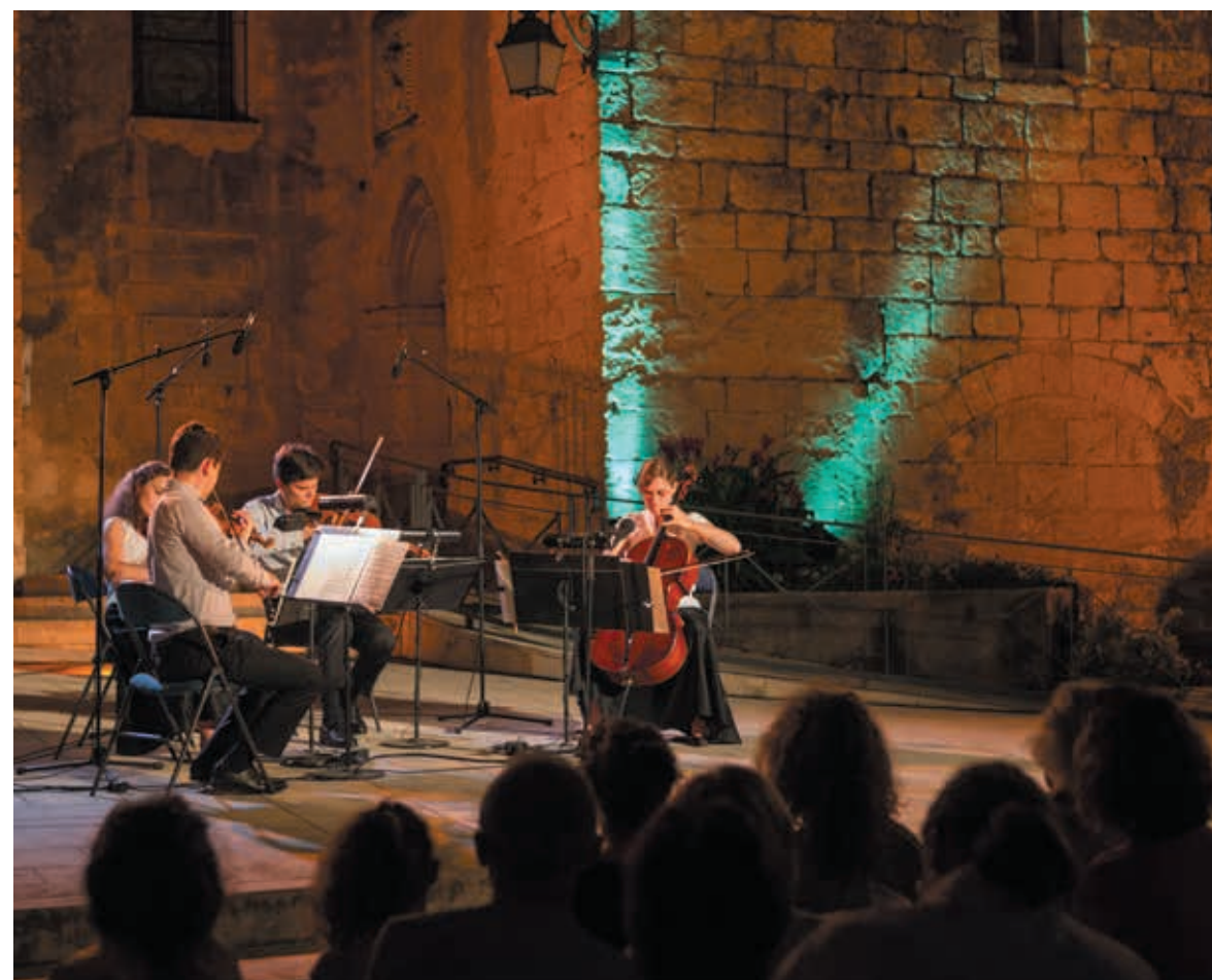
10 000 spectateurs ont assisté l'an dernier aux concerts dans les communes de l'agglomération comme ici, en l'église de Saint Geniès des Mourgues.

Dans toute la région, au cœur du festival, la musique classique proposée pendant quatorze jours fait vibrer les mélomanes et séduit les