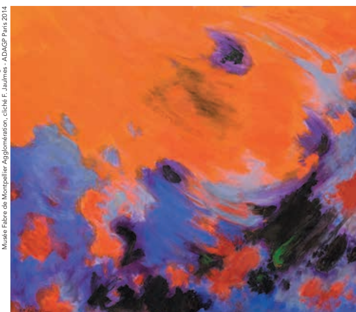
© Extrait de l'œuvre - Maurice-Elie Sarthou, Le grand incendie, 1977 - Musée Fabre de Montpellier Agglomération - ADAGP Paris 2014

Le billet donne accès aux collections permanentes museefabre.fr