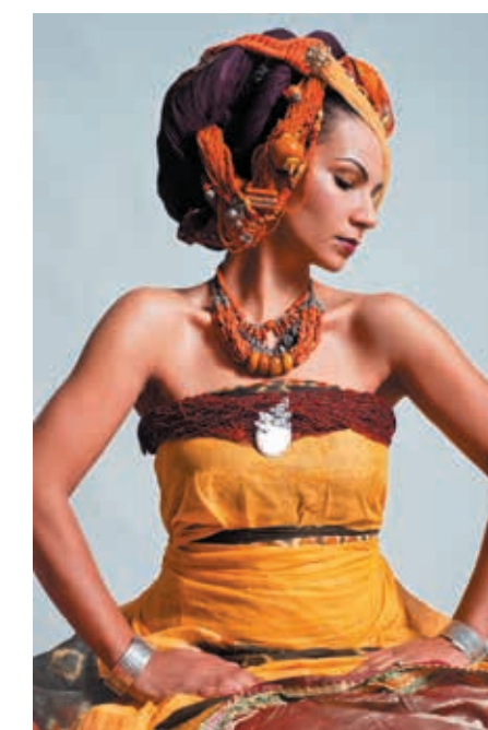
Oum, en concert le samedi 24 mai au Domaine d'O.

TARIFS de 11 à 23€ / 5€ pour les moins de 8 ans Festivalarabesques.fr