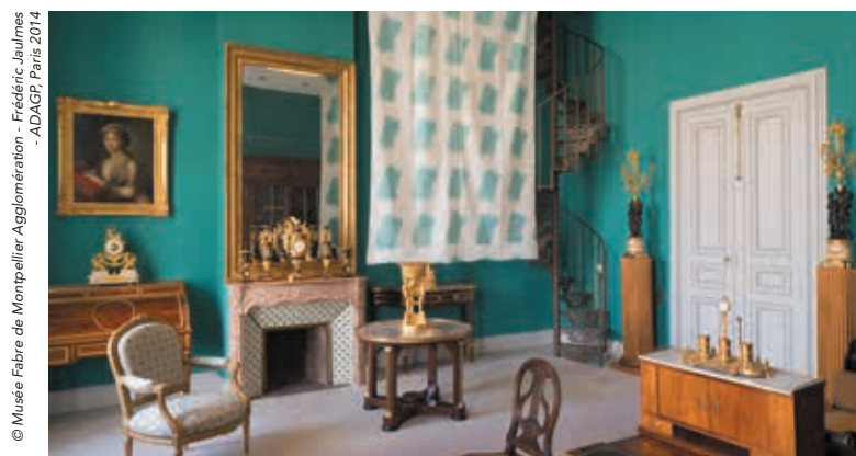
© Musée Fabre de Montpellier Agglomération - Frédéric Jaumes - ADAGP Paris 2014

Du 28 juin au 2 novembre, le musée Fabre consacre sa grande exposition de l'été à Claude Viallat, artiste contemporain de renommée internationale. L'artiste nîmois a été étroitement associé à cette rétrospective, qui présente 150 œuvres éclectiques, dont certaines inédites : toiles sans châssis, bâches, sculptures, objets... Où la forme se répète pour mieux explorer la couleur et la matière.