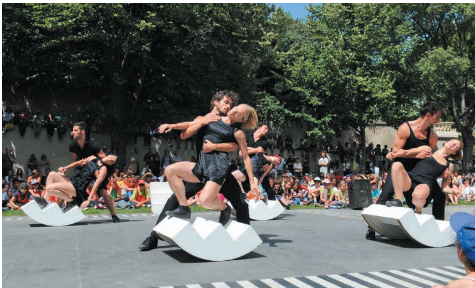
Les danseurs du Groupe Urbain d'Intervention Dansée (G.U.I.D.) d'Angelin Preljocaj, l'an passé, à Montpellier devant le musée Fabre. Ils reviennent du 1 er au 4 juillet, dans six autres communes de l'agglomération.

Du 22 juin au 9 juillet, le festival Montpellier Danse investit les rues de la ville et des communes de l'Agglomération, avec deux spectacles gratuits d'Angelin Preljocaj et Salia Sanou. Dans les salles, cette 34 e édition se recentre autour de l'Agora - Cité internationale de la Danse et offre davantage de tarifs réduits.