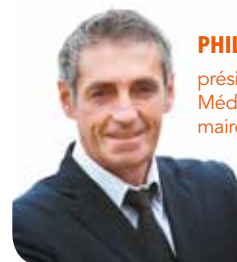
PHILIPPE SAUREL, président de Montpellier Méditerranée Métropole, maire de la Ville de Montpellier

« La nouvelle région accroît la zone de chalandise de l'Open Sud de France »