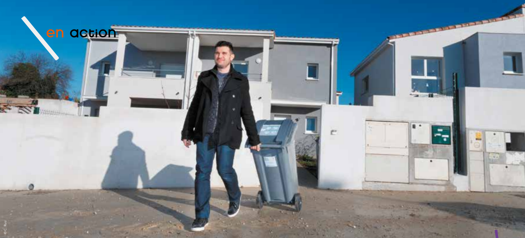
70 000 foyers sont concernés par des changements de fréquences de collecte et tous les foyers par des changements de jours de collecte, au 4 janvier.