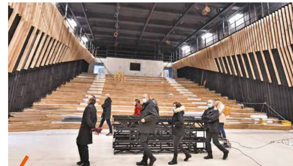
Bluffant par ces volumes lorsque l'on y pénètre, l'auditorium du Conservatoire offre à la fois un grand plateau de scène et une large capacité d'accueil du public avec 400 places.

41,8 millions d'euros hors acquisitions dont 37 millions d'euros par Montpellier Méditerranée Métropole, l'État et la Région Occitanie (2,4 millions d'euros chacun). Acquisition de l'ancienne maternité Grasset : 2,5 millions d'euros.