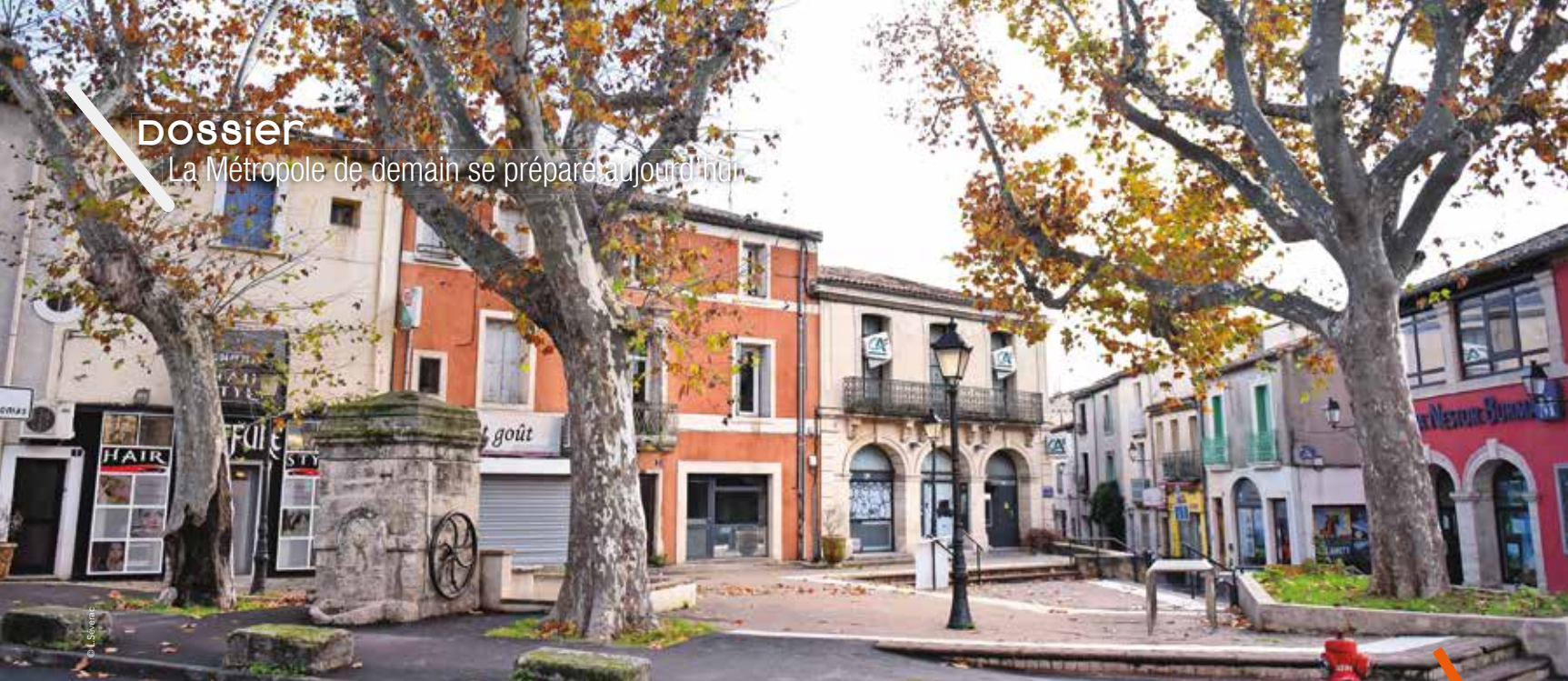
Le quartier de Celleneuve à Montpellier expérimentera le permis de louer dès le 1 er avril.