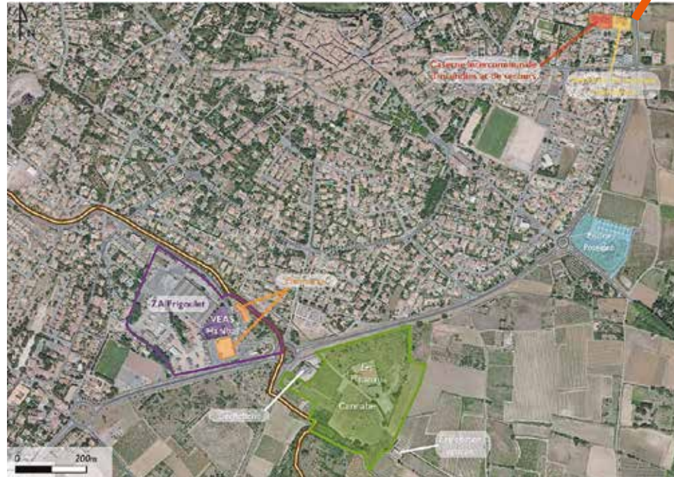
Vue aérienne de la zone de Cannabe, à Cournonterral.

L'offre économique répond à la mise en place d'un véritable « parcours résidentiel à destination des entreprises » par la mise en vente de terrains de construction et la vente de locaux d'activités mixtes au sein d'un Village d'entreprises artisanales et de services (VEAS) privé, voire leur location. Sont ainsi prévus le développement d'un hameau agricole permettant l'accueil de sièges d'exploitations, la préservation de la plaine agricole, la