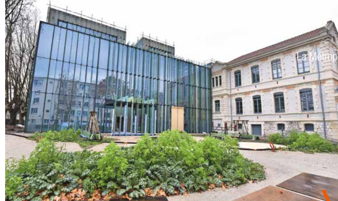
Extérieurement, le nouveau Conservatoire à rayonnement régional se distingue par le mariage réussi entre la pierre du bâtiment de l'ancienne maternité Grasset et la façade moderne en verre qui abrite les différentes salles de musique.