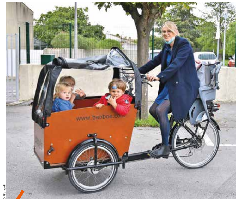
En vélo classique, vélo à assistance électrique ou, comme ici, en vélo cargo, les déplacements à deux-roues s'adaptent aux besoins de chacun.

L'ensemble de l'écosystème cyclable de la métropole va accélérer le rythme pour permettre aux usagers de se déplacer toujours plus facilement et en toute sécurité.