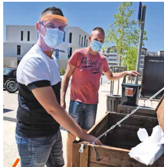
Un composteur est une bonne solution pour réduire ses déchets (épluchures, restes de repas...) de manière vertueuse.