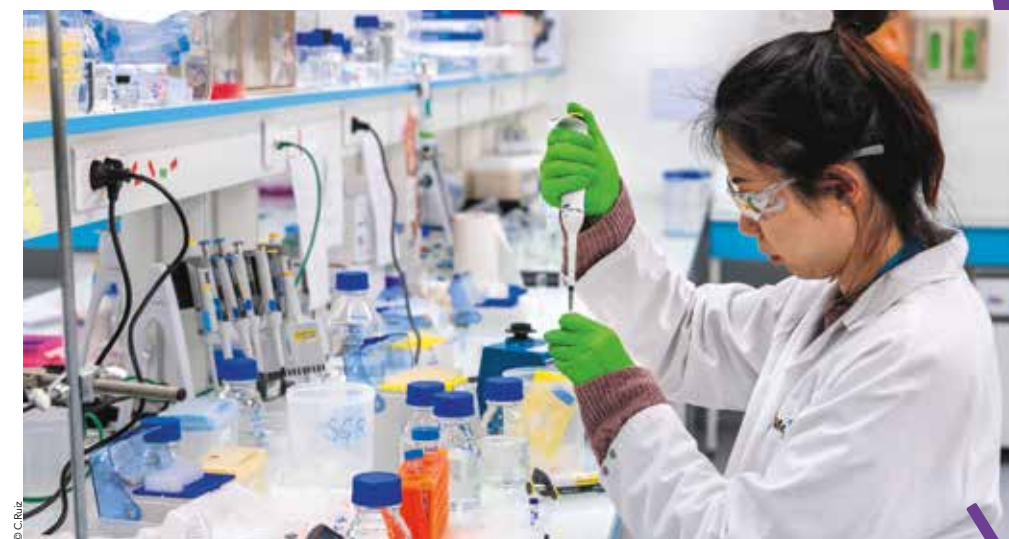
Med Vallée va s'appuyer sur la communauté scientifique montpelliéraine particulièrement riche et talentueuse.