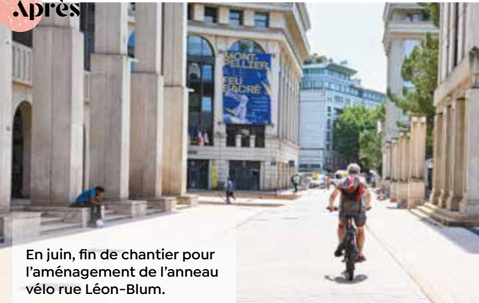
En juin, fin de chantier pour l'aménagement de l'anneau vélo rue Léon-Blum.