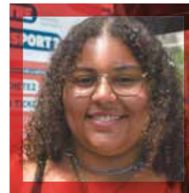
19 ans, Grabels, étudiante en Lettres modernes

“ Je prenais déjà le tram et le bus avant leur gratuité pour aller en cours et pour mes sorties. Si la gratuité des transports publics n'a rien changé à mes habitudes de déplacement, elle me permet de faire des économies et de réorienter le budget que j'y consacrais à d'autres achats, ce qui n'est pas neutre quand on est étudiant. Avec la gratuité, je pense que plus de gens seront plus enclins à privilégier les transports publics plutôt que la voiture, ce qui sera bénéfique pour l'environnement. ”