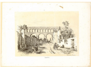
Boilly Julien (dessinateur), Girieud (éditeur), De Boehm (graveur), Aqueduc XIXe s. , Lithographie Propriété de la Ville de Montpellier ©Musée Fabre Montpellier Méditerranée Métropole