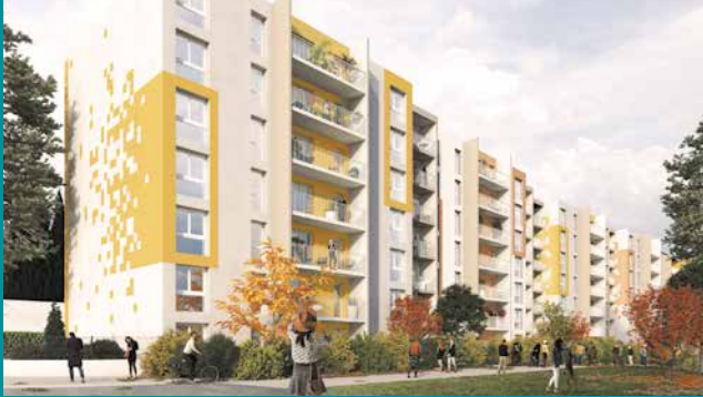
Travaux du bâtiment A

À ce titre, le bâtiment A va bénéficier d'un ambitieux projet de rénovation.